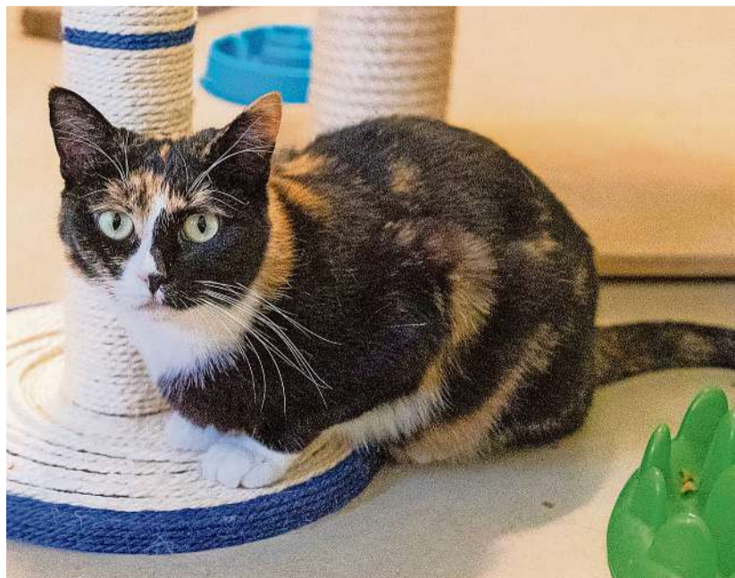
Chichi sucht wieder ein Zuhause als Wohnungskatze, jedoch muss es einen gesicherten Balkon oder eine Terrasse für sie haben.